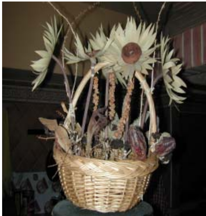
Fig. 4. Cesta de girasoles. Obra de Carmen Bestar, expuesta en el Salón Buffet del Hotel Santiago de Cuba.

Prendedor: este tipo de objeto consiste en la cabeza de una mujer negra y se elaboró con semillas de Mucuna pruriens (ojo de buey), Canna coccinea Mill. (bandera española) y Adenantha pavonina L. (coralina), para la cabeza, los ojos y la boca respectivamente. En el broche se utilizó el exocarpio del fruto de Cocos nucifera .