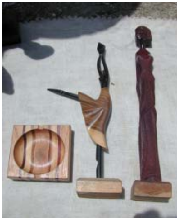
Fig. 5. Objetos de madera que se comercializan en la Gran Piedra, donde se puede apreciar el uso de varias especies maderables para su confección. Anónimo.

Las tarjetas postales y los cuadros: en estos objetos se utilizaron varias especies vegetales que pertenecieron a dos divisiones: Pteridophyta y Magnoliophyta, pero en determinados casos se empleó una