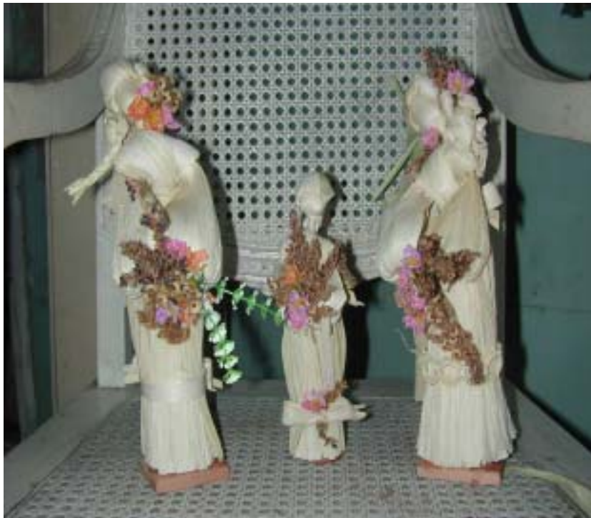
Fig. 2. Muñecas de maíz, obra de Nancy Castro.

En las denominadas muñecas cónicas, el cuerpo se confeccionó a partir de la madera procedente de Cedrela odorata . El vestuario se elaboró con las fibras de Corchorus olitorius L. (yute), las hojas de Coccoloba uvifera L. (uva caleta), Nicotiana tabacum L. y Eichhornia crasipes (Mart.) Solms o las de una especie de lirio no identificada, indistintamente. Para la cabeza se utilizó el fruto de