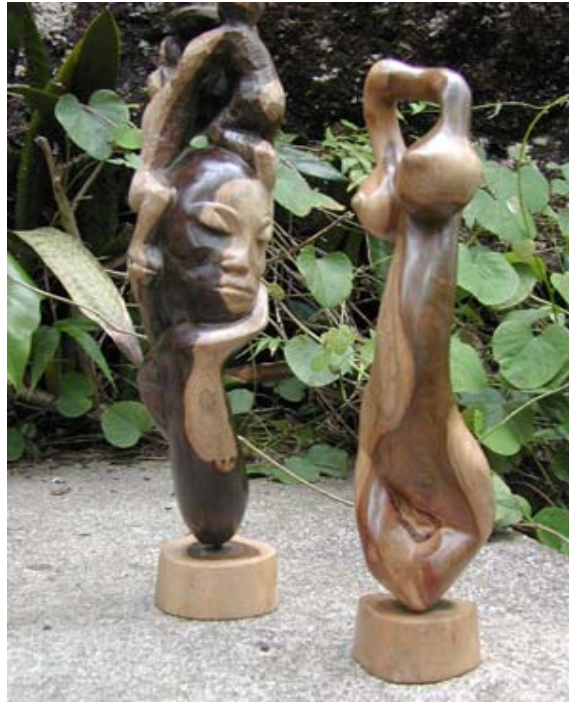
Fig. 6. Esculturas de madera, que se comercializan en la Gran Piedra, confeccionadas con la albura y el duramen procedentes de Guaiacum officinale . Anónimo.

sola de ellas. Adicionalmente, aunque fue raro, en las tarjetas se observaron incorporadas fibras procedentes del peciolo de la hoja de Washingtonia robusta H. Wendl. (palma washingtonia).