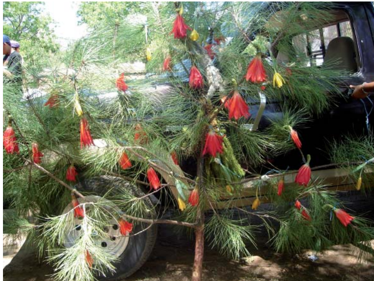
Fig. 7. Rama de Pinus aff. teocote adornada con flores de Disocactus ackermannii y Prothechea karwinskii .

lirio amarillo. Los “concheros” indicaron que los motivos por los cuales participan en esta tradición son tres: a ) la promesa hecha a un santo para colaborar con la decoración de su capilla, b ) colaborar con el comité y seguir manteniendo la tradición y, c ) por iniciativa propia. Cada grupo viaja a una localidad donde los integrantes saben que crecen las plantas que van a buscar y donde han colectado en años previos. Según la información proporcionada por los “concheros”, una vez llegando a la localidad de cosecha se ponen en contacto con las autoridades locales y pagan una cuota por el permiso de colectar plantas. Como instrumentos de colecta los “concheros” llevan machetes, cuerdas, garrochas y costales.