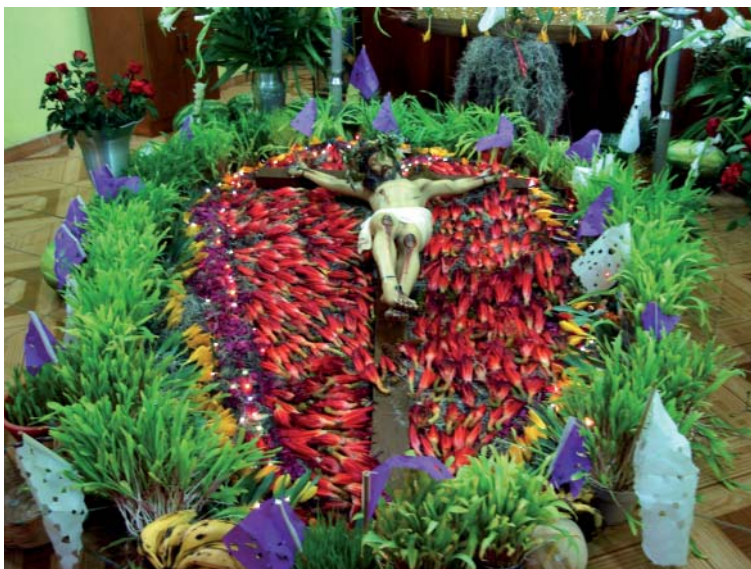
Fig. 3. Lecho del Cristo elaborado en la capilla del barrio La Soledad, Zaachila.

c) Tocados para sombreros, hechos con igual número de flores de lirio amarillo y junco rojo (cuatro a cinco) montadas sobre una mata de heno blanco que se colocan sobre sombreros de palma y son obsequiados a los miembros del comité organizador de cada barrio (Fig. 4).