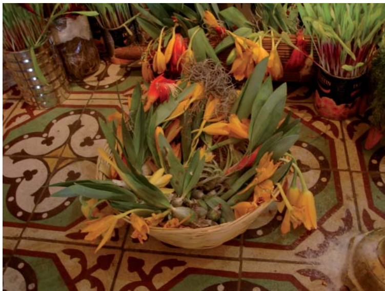
Fig. 5. Canasto de carrizo con ejemplares de Prothechea karwinskii en el interior de la capilla del barrio La Soledad, Zaachila.