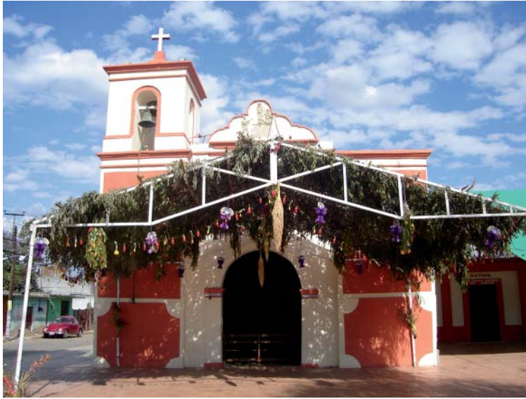
Fig. 6. Ramada hecha con hojas de Dodonea viscosa (jarilla) colocada al frente de una capilla, debajo de ella se observan ramilletes, guirnaldas y en la parte central tres inflorescencias de Phoenix dactylifera (palma datilera).

cerca de 200 flores tanto de lirio amarillo como de junco rojo.