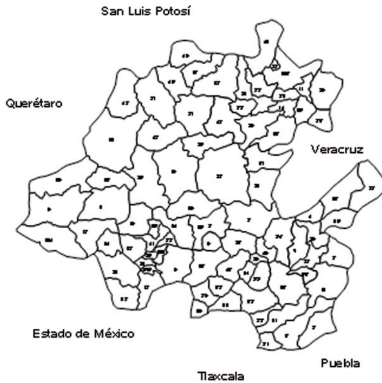
Fig. 2. Municipios del estado de Hidalgo.