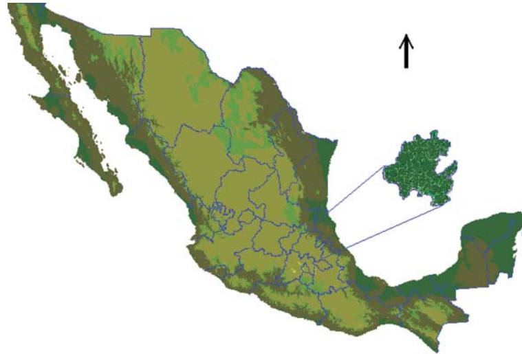
Fig. 1. Ubicación del estado de Hidalgo dentro de la República Mexicana.