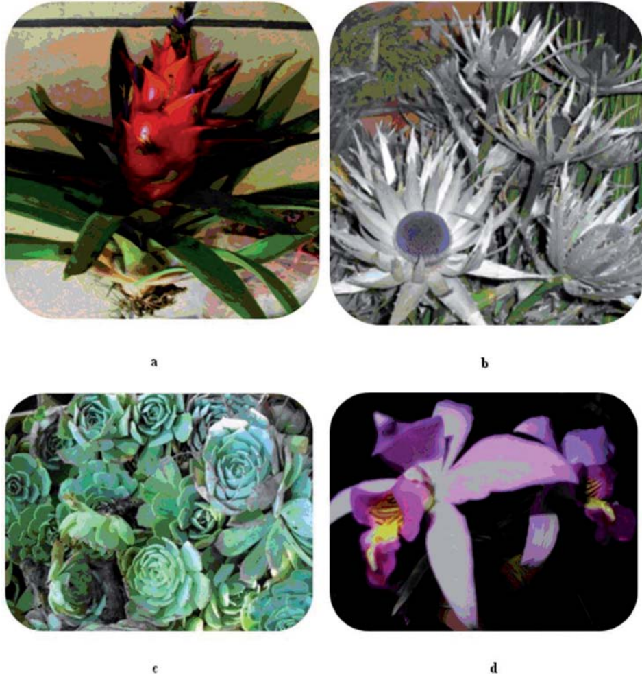
Fig. 3. Especies representativas de los géneros con mayor número de especies comercializadas. a) Tillandsia imperialis E. Morren ex Mez, b) Eyngium proteiflorum F. Delaroche, c) Echeveria secunda Booth ex Lindl. y d) Laelia anceps subsp. anceps .