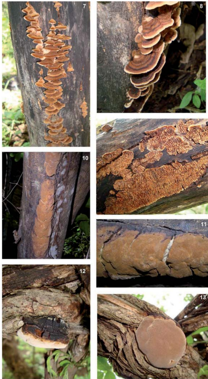
Lámina II. 7-13. 7-9: Gloeophyllum striatum. 10-11: Fomitiporia maxonii. 12-13: Fomitiporia texana.