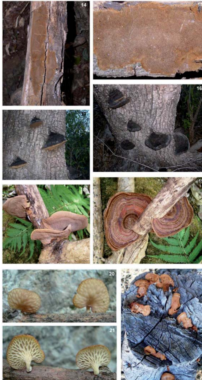
Lámina III: 14-22. 14-15: Inonotus tropicalis. 16-17: Inonotus linteus. 18-19: Hexagonia variegata. 20-21: Polyporus tenuiculus. 22: Pycnoporus sanguineus.