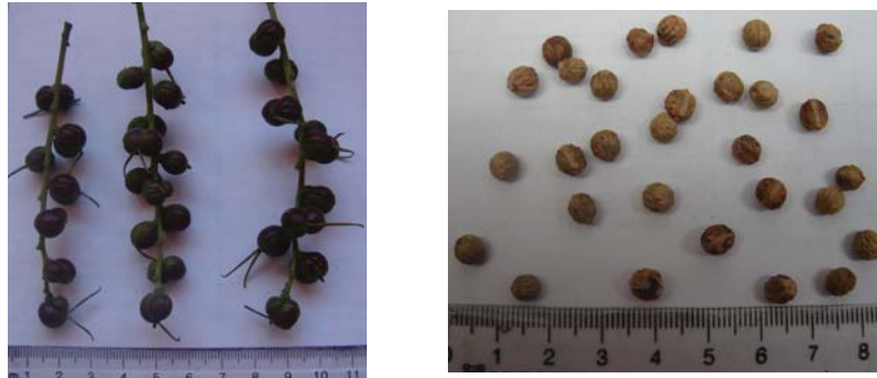
Fig. 2. Infrutescencias y semillas de A. latifolia .