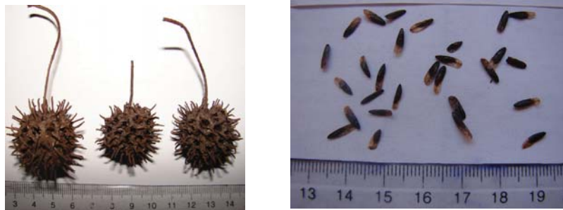
Fig. 3. Infrutescencias y semillas de L. styraciflua .

directamente de la copa del árbol (tomando como referencia los cuatro puntos cardinales) y se cuantificó el número y peso fresco (gramos) de semillas por infrutescencia en una muestra de 50 infrutescencias por árbol. Se comparó la producción de infrutescencias por rama, el número y peso de las semillas por infrutescencia entre especies a través de análisis de varianza de una vía anidados (Zar, 1984). En el modelo, la especie fue el factor fijo y el individuo se anidó dentro de la especie para controlar la posible fuente de variación asociada a este término (Zar, 1984). Las variables de respuesta (número