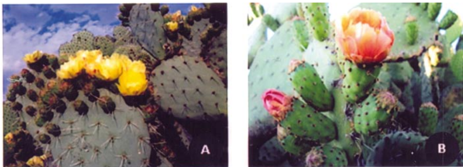
Fig. 1. Ejemplar adulto de Opuntia robusta (A) y de O. streptacantha (B), abundantes en el estado de Jalisco, México.

cuatro: Opuntia ficus-indica , O. undulata , O. megacantha y O. streptacantha ; otras tres se utilizan sólo con fines ornamentales ( O. microdasys , O. pumila y O. pubescens ); mientras que las demás no son aprovechadas (Arreola-Nava, 1990). La gran variedad de especies de Opuntia no cultivadas que crecen en la región del altiplano, en el estado de Jalisco, incluyen plantas arbustivas como O. robusta (“nopal tapón”) (fig. 1A), O. cantabrigiensis (“nopal cuijo”), O. rastrera (“nopal rastrero”), O. lindheimeri (“nopal cacanao”), O. leptocaulis (“nopal tasajillo”); arborecentes leñosas como O. leucotricha (“nopal duraznillo”), O. streptacantha (“nopal cardón”) (fig. 1B). Estas especies, junto con los agaves y mezquites, constituyen organismos clave en las comunidades bióticas y una potencial fuente de alimento y de ingreso económico para los pobladores de la región Altos Norte del estado de Jalisco; sin embargo, algunas especies continúan siendo utilizadas únicamente a nivel local y se comercializan solamente en mercados regionales, por lo que se requiere estudiar las características morfológicas y químicas de