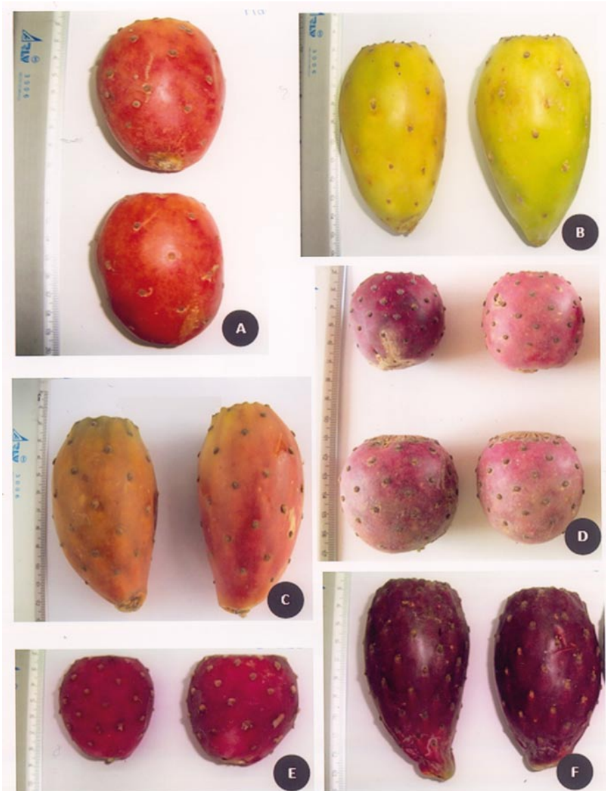
Fig. 3. Frutos maduros de cultivares silvestres de Opuntia recolectados en Lagos de Moreno, Jal., México: “manza naranja” (A), “manza blanca” (B), “calabazona” (C), “memela” (D), “chavena” (E) y “sangre de toro” (F).