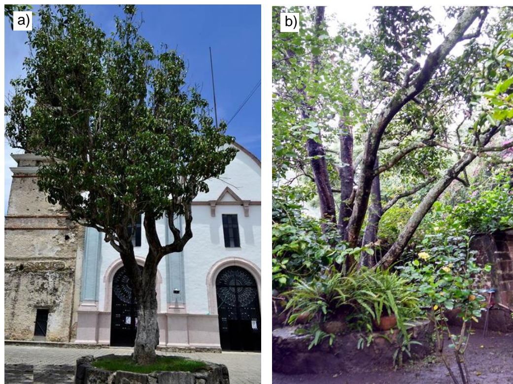
Fig. 1. Árboles de Yuloxóchitl, a) en el atrio de la iglesia de Zumpahuacán, b) en un predio particular en Malinalco, ambos en el Estado de México.